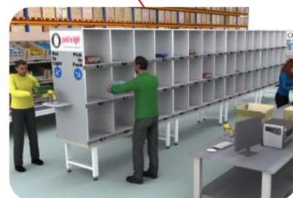
Pick to pack