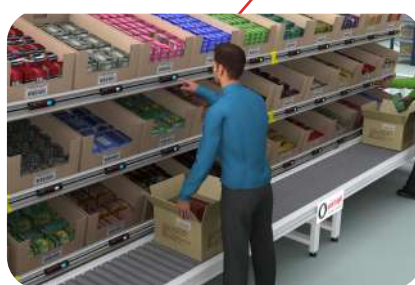
Pick to light